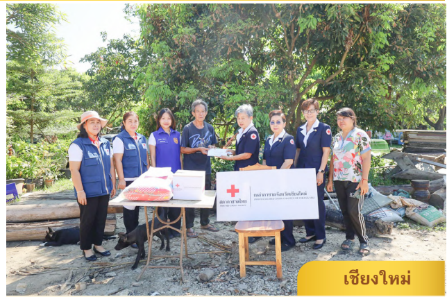
เชียงใหม่

สุพรรณบุรี คณะกรรมการและสมาชิกเหล่ากาชาดจังหวัดสุพรรณบุรี ลงพื้นที่ช่วยเหลือราษฎรผู้ประสบเหตุอุทกภัย จำนวน 50 ราย พร้อมทั้งมอบถุงยังชีพ เพื่อเป็นการบรรเทาความเดือดร้อนและเป็นขวัญกำลังใจต่อไป ในเขตพื้นที่ตำบลบางตาเถร อำเภอสองพี่น้อง