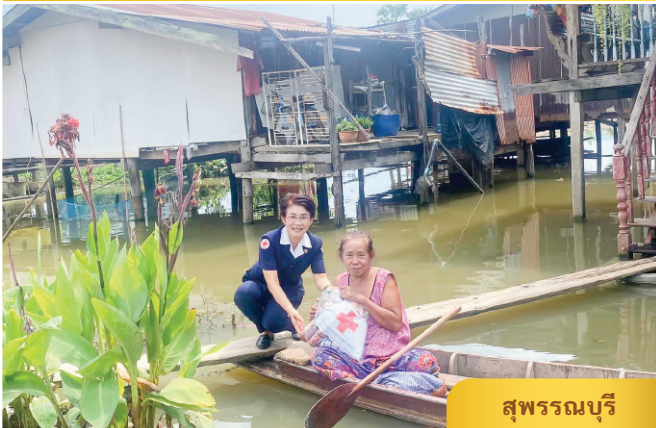
สุพรรณบุรี

สุพรรณบุรี คณะกรรมการและสมาชิกเหล่ากาชาดจังหวัดสุพรรณบุรี ลงพื้นที่ช่วยเหลือราษฎรผู้ประสบเหตุอุทกภัย จำนวน 50 ราย พร้อมทั้งมอบถุงยังชีพ เพื่อเป็นการบรรเทาความเดือดร้อนและเป็นขวัญกำลังใจต่อไป ในเขตพื้นที่ตำบลบางตาเถร อำเภอสองพี่น้อง