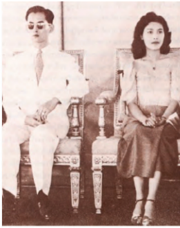
๒ กุมภาพันธ์ ๒๔๙๖ ตั้งสภาคัดพยาบาล