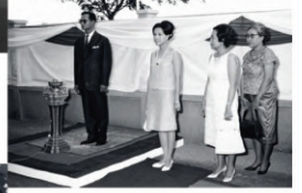
๒๘ พฤศจิกายน ๒๕๑๐ ตั้งบงกฏ-เพรสตัน