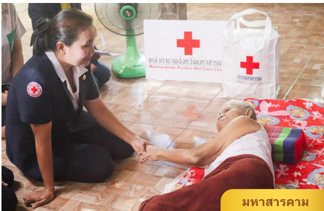
มหาสารคาม

เชียงใหม่ คณะกรรมการและสมาชิกเหล่ากาชาดจังหวัดเชียงใหม่ ลงพื้นที่ช่วยเหลือราษฎรผู้ประสบเหตุอัคคีภัย (ไฟไหม้บ้านทั้งหลัง) พร้อมทั้งมอบเงินช่วยเหลือและเครื่องอุปโภค-บริโภค เพื่อเป็นการบรรเทาความเดือดร้อนในเบื้องต้น ในเขตพื้นที่ ตำบลบ้านช้าง อำเภอแม่แตง