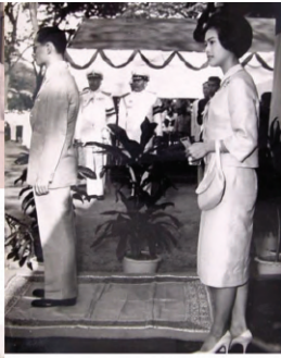
๒๒ มีนาคม ๒๕๐๘ ตั้งพระยามาวราชเสวรี และกษัตริย์หญิง