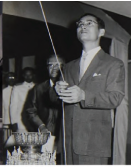
๒๘ พฤศจิกายน ๒๕๐๘ ตั้งบวมินทรานัน (หลังเก่า)