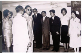
๘ พฤศจิกายน ๒๕๐๘ ตั้งธนาคารกรุงเทวม