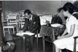
๑๙ สิงหาคม ๒๕๐๘ ตั้งโคบอลต์