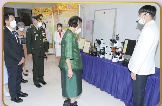
ทอดพระเนตรนิทรรศการอาคารศรีสวรินทิราอนุสรณ์ 150 ปี โรงพยาบาลสมเด็จพระบรมราชเทวี ณ ศรีราชา สภากาชาดไทย