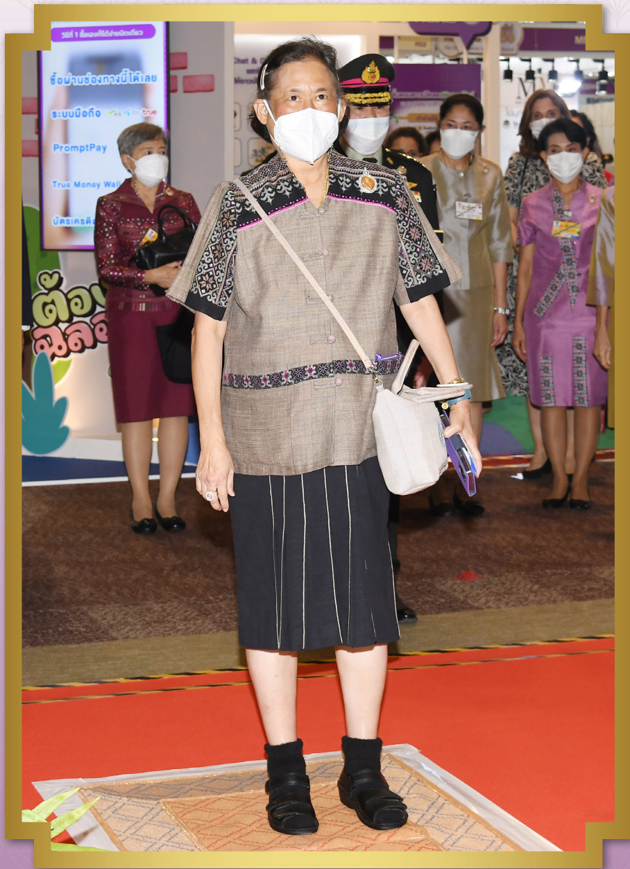
พระราชกรณียกิจ เดือนกุมภาพันธ์