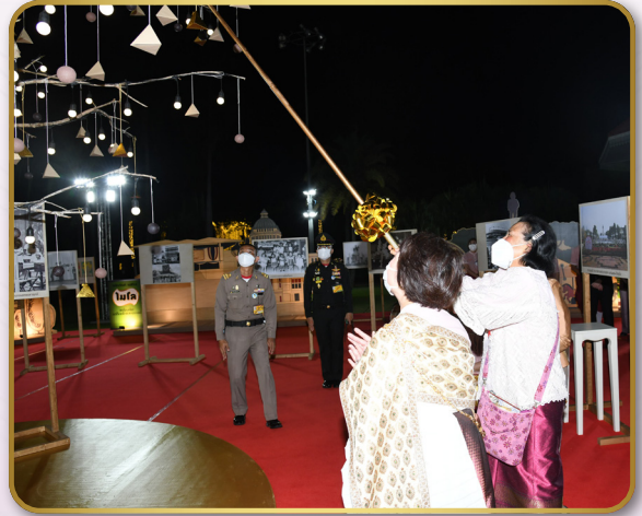
ทอดพระเนตรนิทรรศการงานวันกาชาด 100 ปี และทรงสอยผลต้นกล้วยพฤกษ์ ณ สวนลุมพินี เขตปทุมวัน กรุงเทพมหานคร