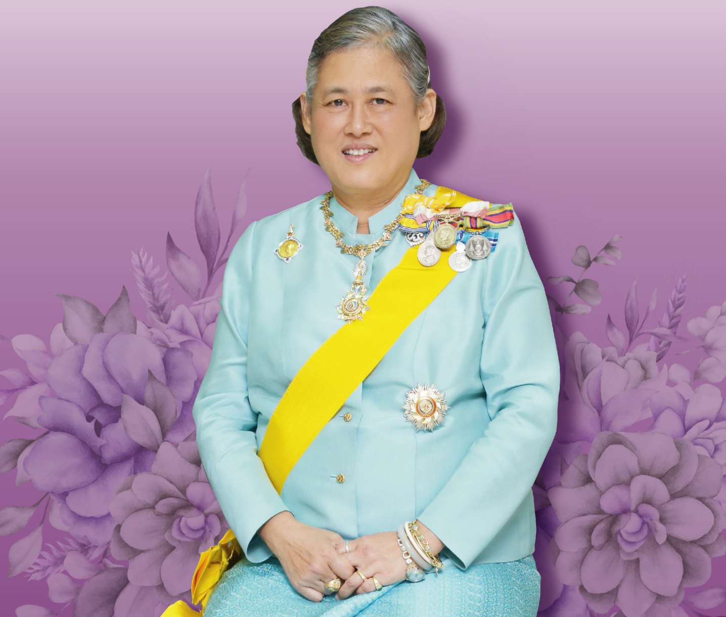
พระราชกรณียกิจ ประจำปีพุทธศักราช 2566 สมเด็จพระกนิษฐาธิราชเจ้า กรมสมเด็จพระเทพรัตนราชสุดา ฯ สยามบรมราชกุมารี อุปนายกผู้อำนวยการสภาภาษาไทย