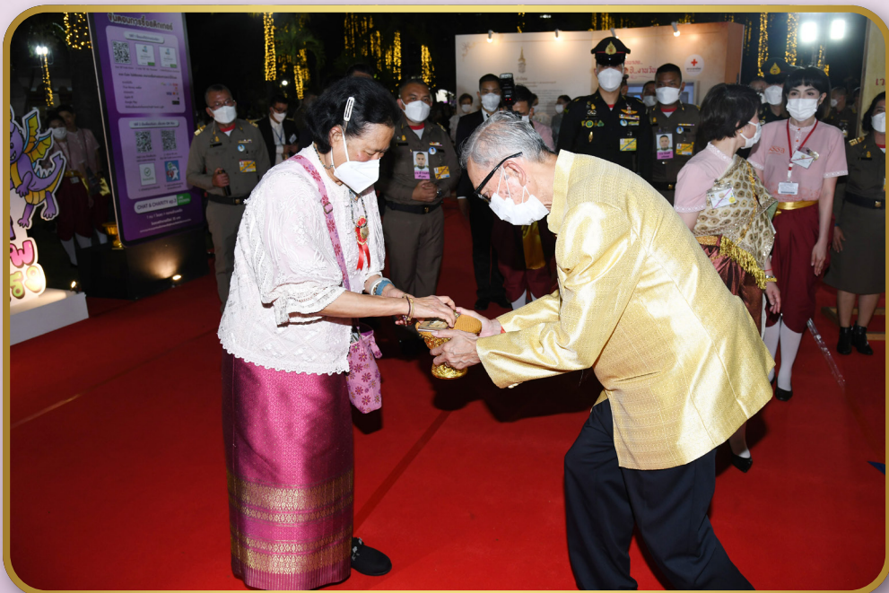
ประธานคณะกรรมการอำนวยการจัดงานวันกาชาด 100 ปี พุทธศักราช 2566 ทูลเกล้าฯ ถวายสลากบำรุงสภากาชาดไทย ณ สวนลุมพินี เขตปทุมวัน กรุงเทพมหานคร