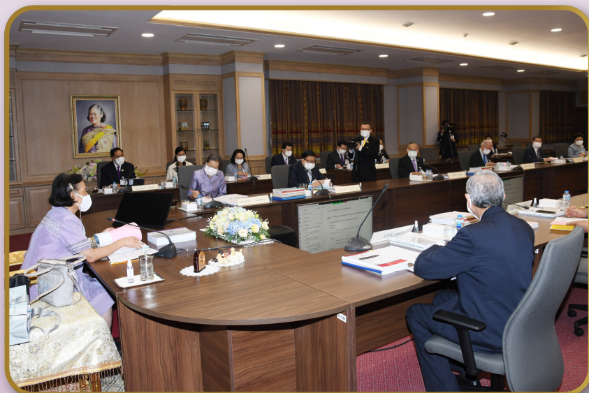
ทรงเป็นประธานการประชุมคณะกรรมการสภาการศึกษาไทย ครั้งที่ 348 ณ ห้องประชุมใหญ่ ชั้น 9 อาคารเทิดพระเกียรติสมเด็จพระญาณสังวร (เจริญ สุวฑฺฒโน) สภาการศึกษาไทย