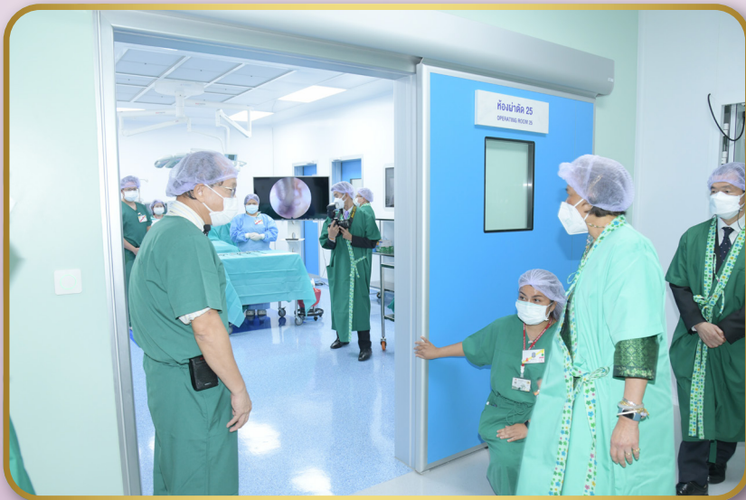
ทอดพระเนตรห้องผ่าตัด ห้องสวนหัวใจ อาคารศรีสวรินทิราอนุสรณ์ 150 ปี โรงพยาบาลสมเด็จพระบรมราชเทวี ฉัตรราชฯ สภากาชาดไทย