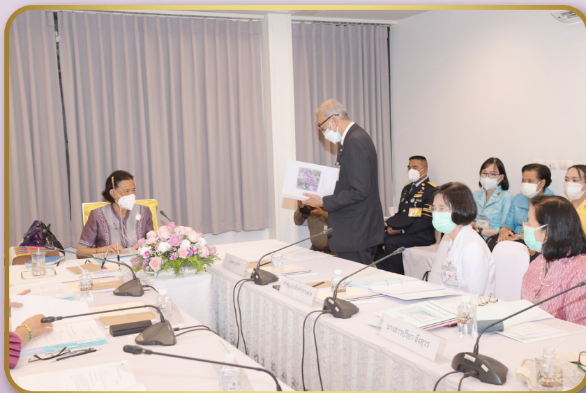
ทรงเป็นประธานการประชุมคณะกรรมการอำนวยการมูลนิธิสงเคราะห์เด็กของสภากาชาดไทย ประจำปี 2566 ณ อาคารวชิราลงกรณ มูลนิธิสงเคราะห์เด็กของสภากาชาดไทย