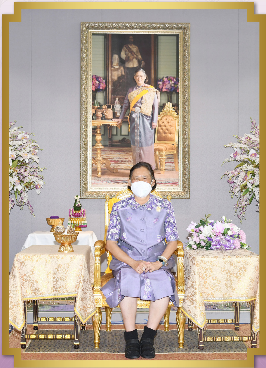
พระราชกรณียกิจ เดือนมีนาคม