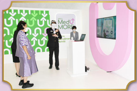
ทรงกดปุ่มไฟฟ้าเปิดแพรคลุมป้าย “อาคารรัตนวิทยาพัฒนา” พร้อมทอดพระเนตรนิทรรศการ 108 ปี โรงพยาบาลจุฬาลงกรณ์ สภากาชาดไทย