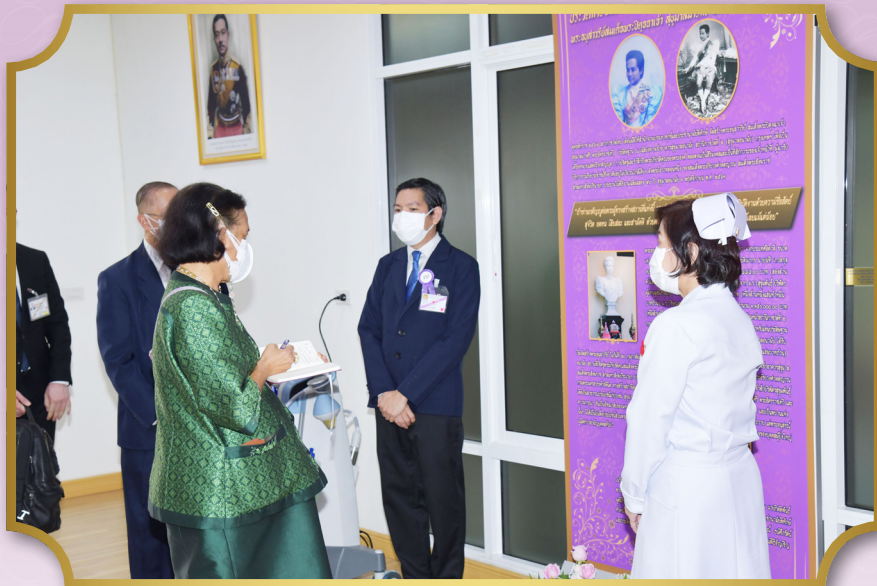
ทรงเปิดพระอนุสาวรีย์สมเด็จพระปิตุจฉาเจ้า สุขุมมาลมารศรี พระอัครราชเทวี พร้อมทอดพระเนตรนิทรรศการประวัติศาสตร์ก่อตั้งสถานีกาชาดที่ 2 (สุขุมมาลนามัย) ณ สถานีกาชาดที่ 2 (สุขุมมาลนามัย) เขตพระนคร กรุงเทพฯ