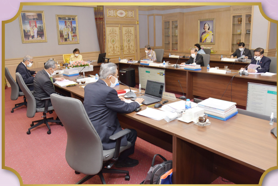
ทรงเป็นประธานการประชุมคณะกรรมการสภาอากาศไทย ครั้งที่ 346 ณ อาคารเทิดพระเกียรติสมเด็จพระญาณสังวรฯ สภาอากาศไทย