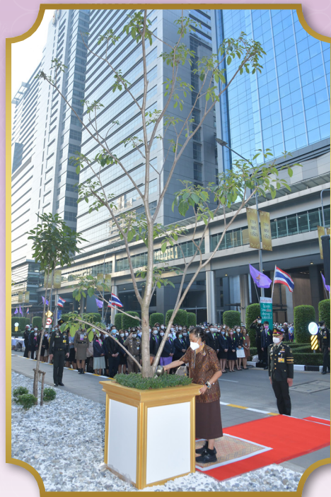
ทรงปลูกต้นชมพูพันธุ์ทิพย์ บริเวณหน้าอาคารอำนวยการอำนวยการ คณะแพทยศาสตร์ จุฬาลงกรณ์มหาวิทยาลัย