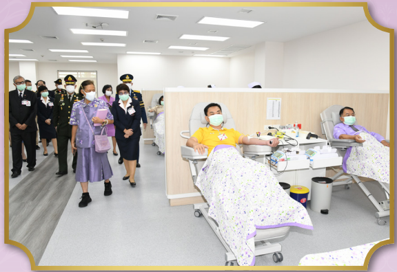
ทรงเปิดอาคารภาคบริการโลหิตแห่งชาติที่ 4 จังหวัดราชบุรี ณ ตำบลพงสวาย อำเภอเมืองราชบุรี จังหวัดราชบุรี