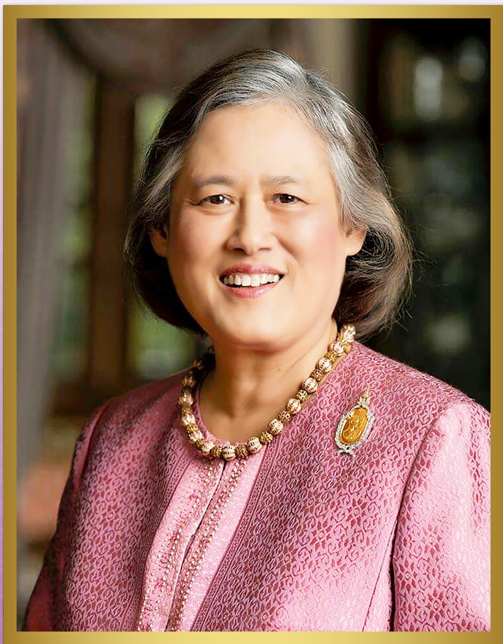
พระราชกรณียกิจ เดือนเมษายน