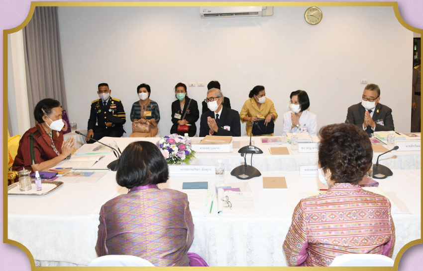
ทรงเป็นประธานการประชุมคณะกรรมการอำนวยการมูลนิธิสงเคราะห์เด็กของสภากาชาดไทย ประจำปี 2565 ณ อาคารวชิราลงกรณ สภากาชาดไทย