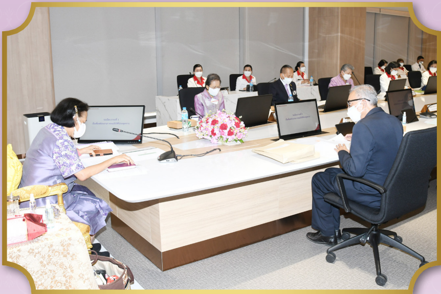
ทรงเป็นประธานการประชุมสภาสถาบันการพยาบาลศรีสวรินทิรา สภากาชาดไทย ครั้งที่ 40 ณ อาคารสิรินธรานุสรณ์ 60 พรรษา สถาบันการพยาบาลศรีสวรินทิรา สภากาชาดไทย