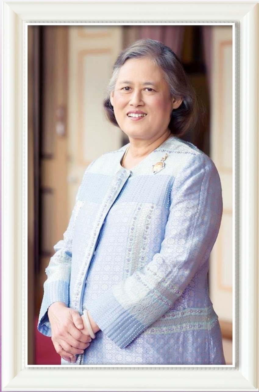
พระราชกรณียกิจ ประจำปีพุทธศักราช 2565 สมเด็จพระกนิษฐาธิราชเจ้า กรมสมเด็จพระเทพรัตนราชสุดา ฯ สยามบรมราชกุมารี อุปนายกผู้อำนวยการสภาภาษาชาติไทย