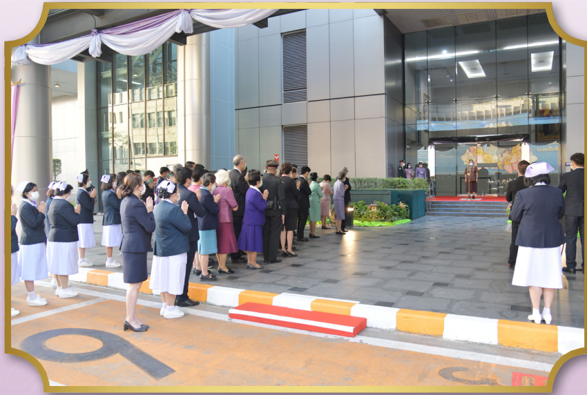
พระราชทานพรเนื่องในโอกาสวันขึ้นปีใหม่ 2566 แก่บุคลากรของสภาอากาศไทย ตลอดจนประชาชนที่เฝ้าฯ รับเสด็จ