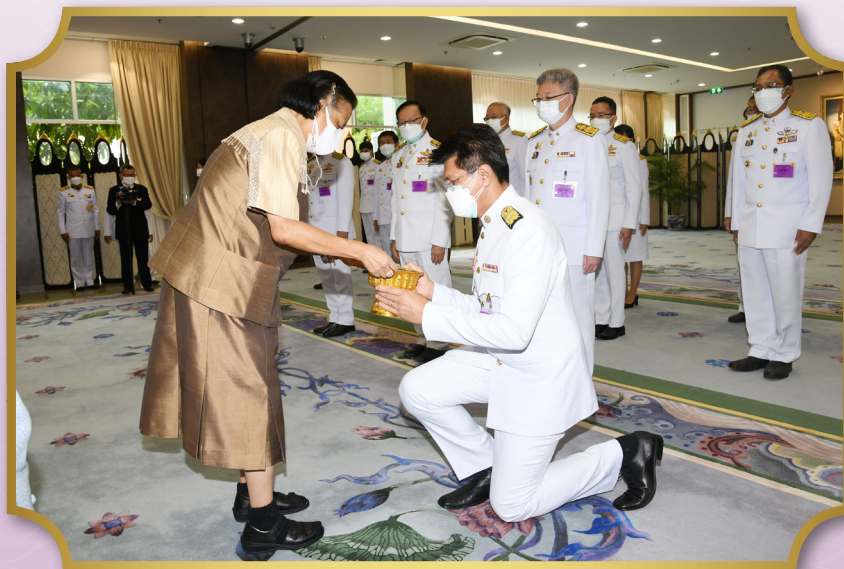
นายสาธิต ปิตุเตชะ รัฐมนตรีช่วยว่าการกระทรวงสาธารณสุข นำคณะผู้บริหารกระทรวงสาธารณสุข เข้าเฝ้าฯ ทูลเกล้าฯ ถวายเงินรายได้จากการจำหน่ายสลากบำรุงสภากาชาดไทย ในงานกาชาดออนไลน์ ประจำปี 2564 เพื่อบำรุงสภากาชาดไทย ณ วังสระปทุม