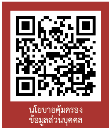
นโยบายคุ้มครอง ข้อมูลส่วนบุคคล