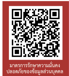
มาตรฐานรักษาความมั่นคง ปลอดภัยของข้อมูลส่วนบุคคล