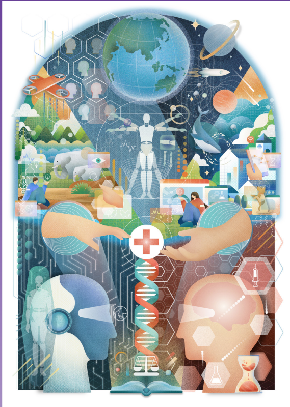
นางสาวสิริปริยา คุ่มขำ รางวัลที่ 1 ประเภทเยาวชน