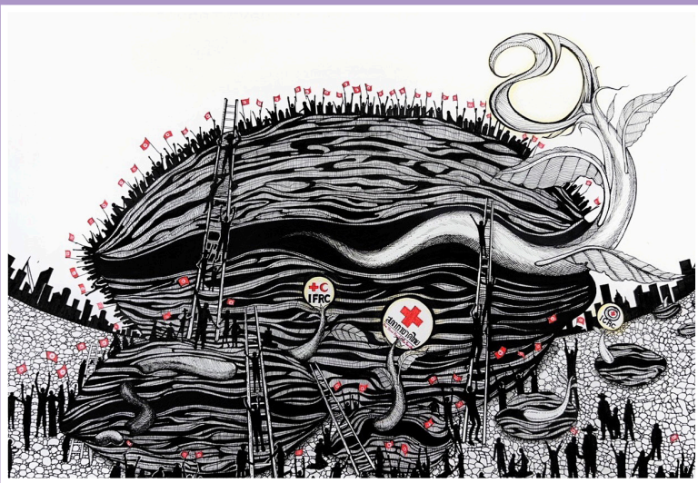
นายฤกษ์ตมาพันธ์ วัชรไชยสกุล รางวัลที่ 1 ประเภทอายุ 26 ปีขึ้นไป